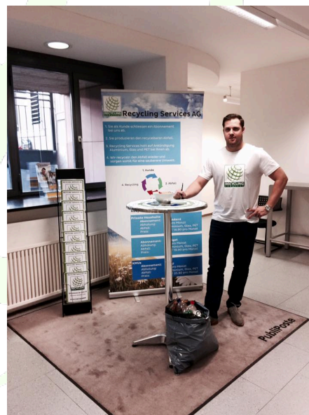
Bild: Poststelle Bellevue Zürich

Erste Fazits können nach einigen Aktionen gezogen werden: